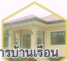
อาคารบ้านเรือน