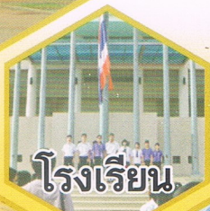
โรงเรียน