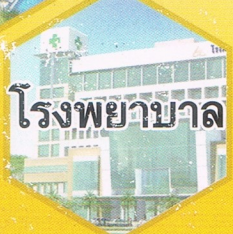
โรงพยาบาล