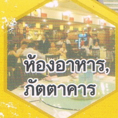
ห้องอาหาร, ภัตตาคาร