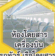
ห้องโดยสาร เครื่องบิน